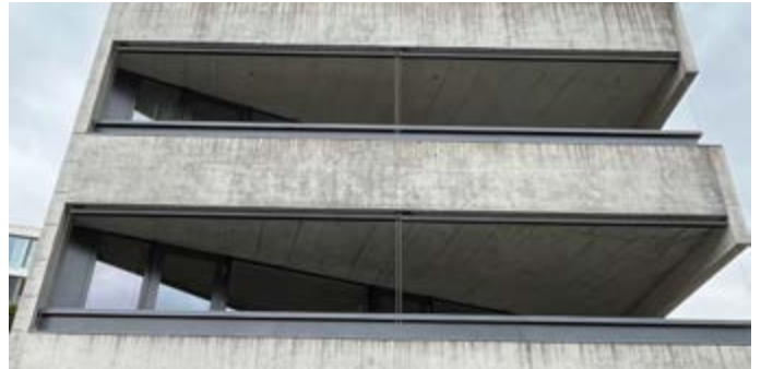
Vor der Behandlung: Gealterter, vom Regenwasser und dessen Verschmutzungen gezeichneter Sichtbeton.

Gereinigte und von den Betonspezialisten renovierte Gebäudefassade. Lunker im Sichtbeton wurden mit mineralischem Spachtel gefüllt. Die störend heterogen wirkenden Oberflächen wurden betongerecht mit verschiedenen farbigen mineralischen Lasuren egalisiert und erneuert.